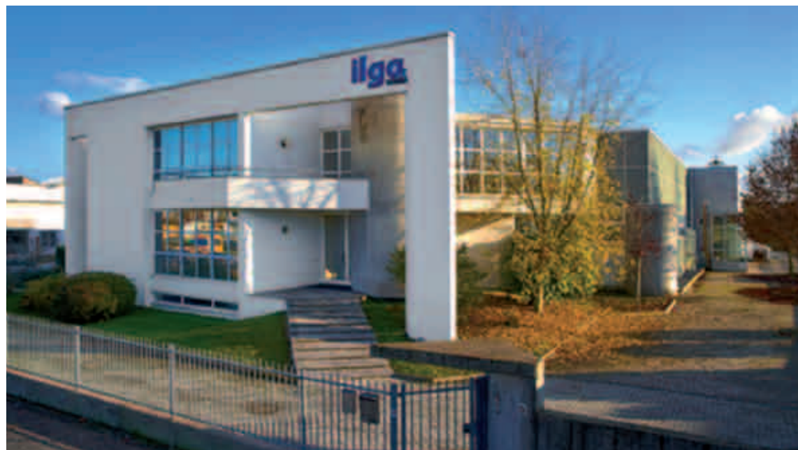
La nuova sede di Vigevano della Ilga Gomma , dove opera una quindicina di addetti

«In vent'anni abbiamo sempre reinvestito gli utili nella società. Tut-